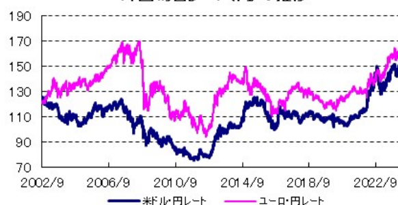
外国為替レート(円)の推移

全てのデータの出所はBloomberg、野村総合研究所です。NOMURA-BPIとは、日本国内債券市場で発行されている代表的な公社債の流通動向を的確に表す投資収益指数です。当指数は、野村フィデューシャリー・リサーチ&コンサルティング株式会社によって計算、公表されている、野村フィデューシャリー・リサーチ&コンサルティング株式会社の知的財産です。なお、同社は、当指数を用いて運用されるファンドの運用成果等に関して一切責任を負いません。MSCIコクサイ指数とは、MSCI Inc.が所有する株価指数で、世界の主要先進国の株式市場の動きを捉える基準として、広く認知されているものです。FTSE世界国債インデックスは、FTSE Fixed Income LLCにより運営されている債券インデックスです。同指数はFTSE Fixed Income LLCの知的財産であり、指数に関するすべての権利はFTSE Fixed Income LLCが有しています。