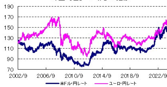
外国為替レート(円)の推移

全てのデータの出所はBloomberg、野村総合研究所です。NOMURA-BPIとは、日本国内債券市場で発行されている代表的な公社債の流通動向を的確に表す投資収益指数です。当指数は、野村フィデューシャリー・リサーチ&コンサルティング株式会社によって計算、公表されている、野村フィデューシャリー・リサーチ&コンサルティング株式会社の知的財産です。なお、当指数を用いて運用されるファンドの運用成果等に関して一切責任を負いません。MSCIコクサイ指数とは、MSCI Inc.が所有する株価指数で、世界の主要先進国の株式市場の動きを捉える基準として、広く認知されているものです。FTSE世界国債インデックスは、FTSE Fixed Income LLCにより運営されている債券インデックスです。同指数はFTSE Fixed Income LLCの知的財産であり、指数に関するすべての権利はFTSE Fixed Income LLCが有しています。