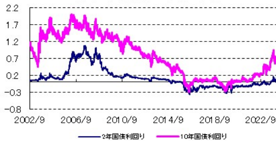
日本の国債利回り(%)の推移