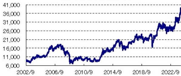
日経平均株価(円)の推移