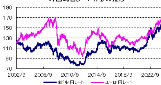
外国為替レート(円)の推移

全てのデータの出所はBloomberg、野村総合研究所です。NOMURA-BPIとは、日本国内債券市場で発行されている代表的な公社債の流通動向を的確に表す投資収益指数です。当指数は、野村フィデューシャリー・リサーチ&コンサルティング株式会社によって計算、公表されている、野村フィデューシャリー・リサーチ&コンサルティング株式会社の知的財産です。なお、当指数を用いて運用されるファンドの運用成果等に関して一切責任を負いません。MSCIコクサイ指数とは、MSCI Inc.が所有する株価指数で、世界の主要先進国の株式市場の動きを捉える基準として、広く認知されているものです。FTSE世界国債インデックスは、FTSE Fixed Income LLCにより運営されている債券インデックスです。同指数はFTSE Fixed Income LLCの知的財産であり、指数に関するすべての権利はFTSE Fixed Income LLCが有しています。