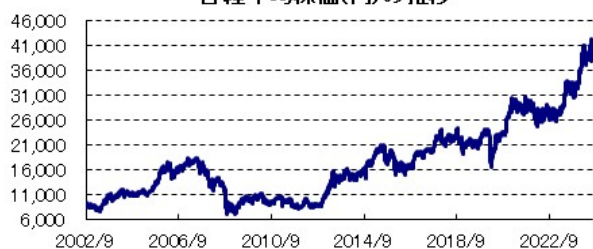
日経平均株価(円)の推移