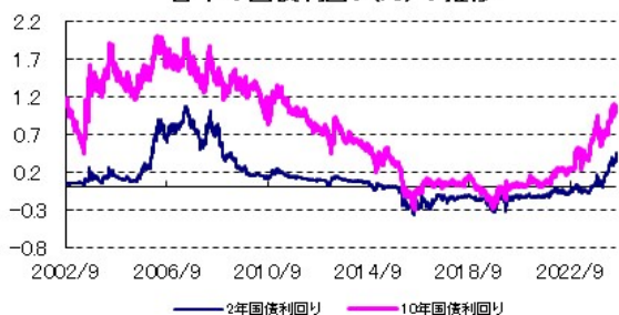
日本の国債利回り(%)の推移