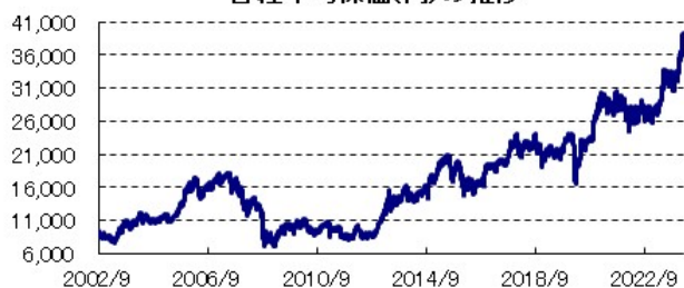
日経平均株価(円)の推移