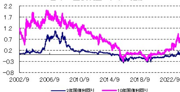
日本の国債利回り(%)の推移