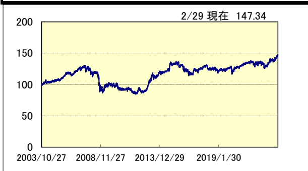
世界バランスファンド25 SS