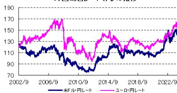
外国為替レート(円)の推移

全てのデータの出所はBloomberg、野村総合研究所です。NOMURA-BPIとは、日本国内債券市場で発行されている代表的な公社債の流通動向を的確に表す投資収益指数です。当指数は、野村フィデューシャリー・リサーチ&コンサルティング株式会社によって計算、公表されている、野村フィデューシャリー・リサーチ&コンサルティング株式会社の知的財産です。なお、同社は、当指数を用いて運用されるファンドの運用成果等に関して一切責任を負いません。MSCIコクサイ指数とは、MSCI Inc.が所有する株価指数で、世界の主要先進国の株式市場の動きを捉える基準として、広く認知されているものです。FTSE世界国債インデックスは、FTSE Fixed Income LLCにより運営されている債券インデックスです。同指数はFTSE Fixed Income LLCの知的財産であり、指数に関するすべての権利はFTSE Fixed Income LLCが有しています。