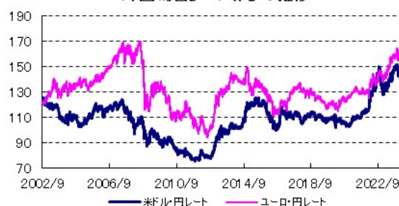
外国為替レート(円)の推移

全てのデータの出所はBloomberg、野村総合研究所です。NOMURA-BPIとは、日本国内債券市場で発行されている代表的な公社債の流通動向を的確に表す投資収益指数です。当指数は、野村フィデューシャリー・リサーチ&コンサルティング株式会社によって計算、公表されている、野村フィデューシャリー・リサーチ&コンサルティング株式会社の知的財産です。なお、同社は、当指数を用いて運用されるファンドの運用成果等に関して一切責任を負いません。MSCIコクサイ指数とは、MSCI Inc.が所有する株価指数で、世界の主要先進国の株式市場の動きを捉える基準として、広く認知されているものです。FTSE世界国債インデックスは、FTSE Fixed Income LLCにより運営されている債券インデックスです。同指数はFTSE Fixed Income LLCの知的財産であり、指数に関するすべての権利はFTSE Fixed Income LLCが有しています。